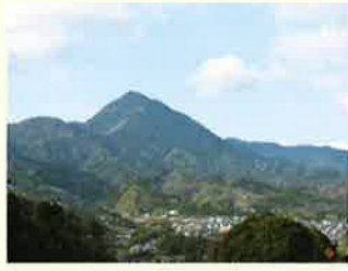
障子山を望む砥部の風景